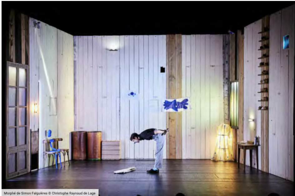
Morphé de Simon Falguières

Le metteur en scène de 35 ans signe cette création dont il est aussi l'auteur et le seul comédien, déployant une fable foisonnante sur la naissance du monde.