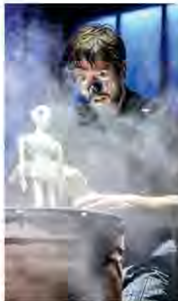
Morphé Jusqu'au 5 nov., au Théâtre Paris-Villette.

Un spectacle hybride et une superbe fable sur la filiation.