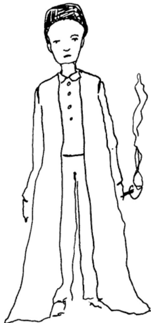
LE JEUNE MOLIÈRE