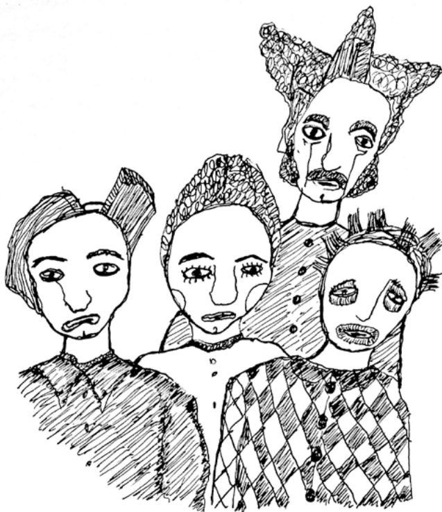
les Masques de l'ébaurdi