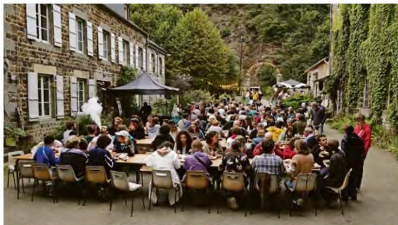
Lors du festival de rentrée du Moulin de l'Hydre, ce week-end.

MOLIÈRE ET SES MASQUES, mise en scène de SIMON FALGUIÈRES. En itinérance autour du Moulin les 13-14 septembre, avec Transversales Scène conventionnée de Verdun la semaine du 23 septembre, et avec la Comédie de Caen pour la saison 2024-25.