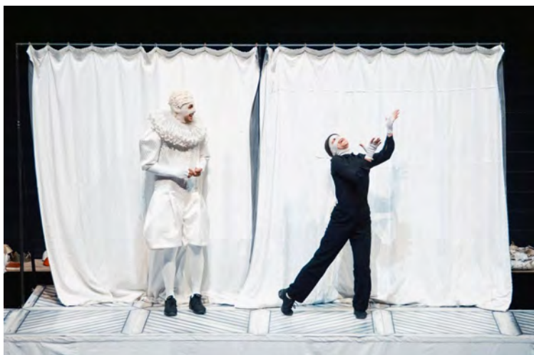
« Molière et ses masques », à voir jusqu’au 24 janvier aux Plateaux Sauvages (20e).

“Les Petites Filles modernes” de Joël Pommerat, “Le Misanthrope” mis en scène par Georges Lavaudant, “Un pas de côté... et l’autre aussi” de Jean-Michel Ribes... Autant de spectacles qu’il faut se dépêcher de réserver avant qu’il ne soit trop tard.