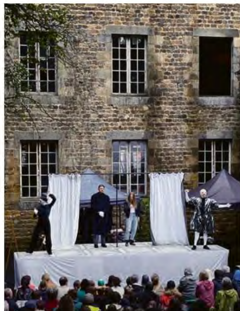
Du jeu, des costumes, et basta.

Le choix, forcément, interroge : pourquoi Molière, figure tutélaire d'un théâtre classique vu et archivé ? «C'est un passe-droit, reconnaît-il. Pour la vie de Molière jouée sur la place du village, les gens se déplacent. Peu de noms font le même effet.» Pragmatisme mis de côté, l'auteur reconnaît s'être pris aux jeux des parallèles entre cette époque et la nôtre, et avoir trouvé dans le XVII e siècle, «période de changements climatiques, de résurgences obscurantistes et d'instabilité politique», une puissante matière théâ-