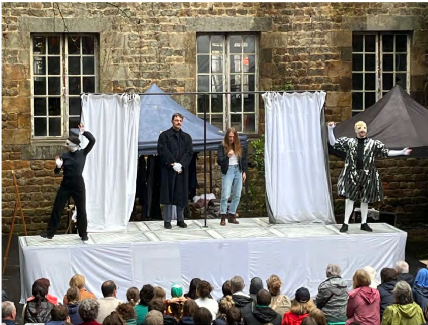
Scène de Molière et ses masques

« Molière et ses masques », la nouvelle pièce de Simon Falguières conçue pour l'itinérance ouvrirait le troisième festival du Moulin de l'Hydre dans l'Orne où Falguières et ses potes œuvrent à l'édification d'une formidable maison et fabrique de théâtre