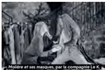
Molière et ses masques, par la compagnie Le K.