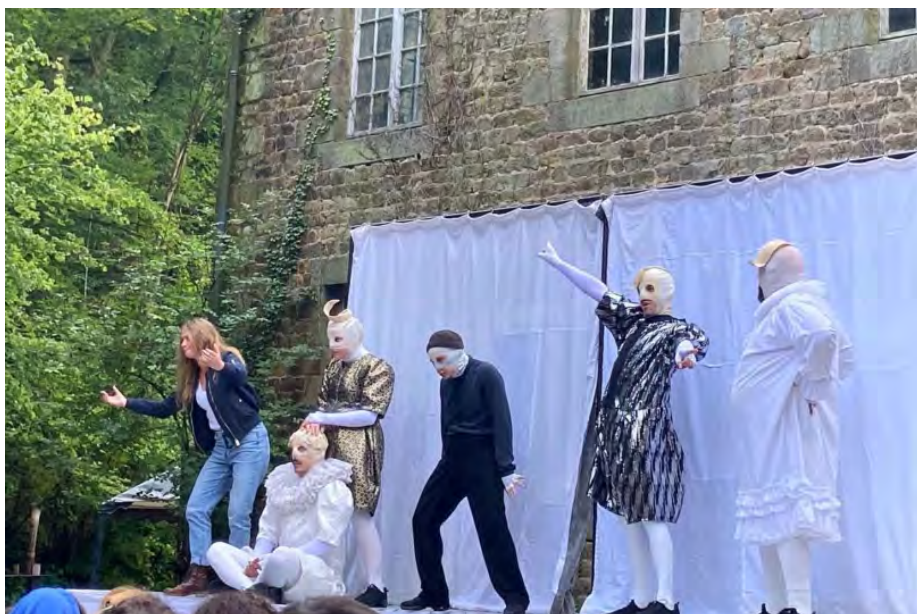
La vie de Molière est expédiée par les six acteurs avec un humour qui puise à des sources diverses.

Molière et ses masques / Le Moulin de l'Hydre / Représentations en itinérance autour des Transversales de Verdun (55) : le 25 septembre à Hanonville-sous-les-Côtes, le 26 à Stenay, le 27 à Verdun et le 28 à Drompcevrin / Tournée en itinérance entre le Moulin de l'Hydre et la Comédie de Caen au printemps 2025.