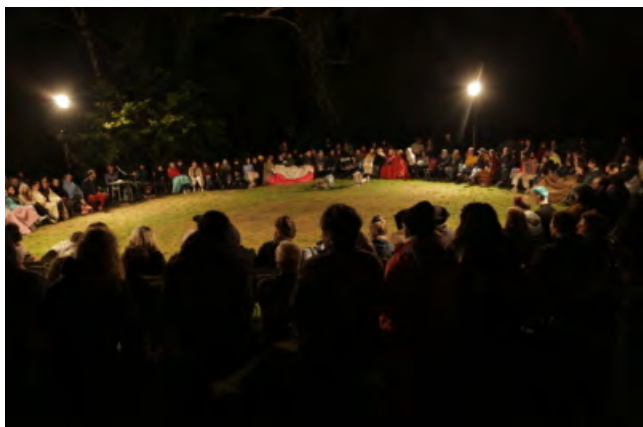
L'une des deux scènes extérieures du Moulin de l'Hydre

Dans Molière et ses masques , Simon Falguières et les constructeurs Alice Delarue et Léandre Gans se gardent d'utiliser les compétences en matière de fabrication qu'ils ont dû déployer au Moulin. Tout se passe sur un tréteau blanc auquel est attaché un rideau qui donne au tout une allure hybride, entre la scène de théâtre et le radeau. Ce drôle d'attelage est fait de manière à pouvoir prendre la route et les chemins, d'abord en Normandie puis ailleurs. Car, s'il a désormais son lieu, le directeur de compagnie refuse de s'y replier.