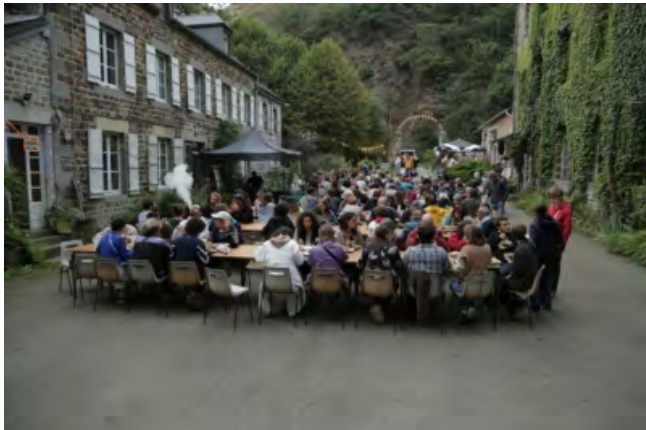
Les grandes tablées du Moulin de l'Hydre

Dans les créations de Simon Falguières, le théâtre est ainsi à la fois un lieu concret, familier, et l'endroit d'où partent les mythes. C'est l'espace d'une utopie en marche, que lui et une poignée de fidèles complices travaillent aussi depuis quelques années à incarner dans des murs : ceux d'une ancienne filature du XIXe siècle du petit village de Saint-Pierre-d'Entremont, en pleine vallée du Noireau (Orne), qu'ils rénovent et occupent.