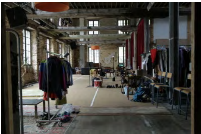
L'espace de stockage du Moulin de l'Hydre

En suivant Simon Falguières depuis la partie déjà totalement rénovée de son logis – soit l'ancien moulin à eau, qui accueille notamment une cuisine et des logements pour les artistes accueillis en résidence de mars à octobre – jusqu'à celles qui attendent encore de recevoir les soins des Bernards l'Hermite, on a parfois la sensation d'entrer dans l'univers de ses épopées évoquées plus tôt. Lui-même, après avoir donné quelques détails de son complexe montage financier et matériel, où les ressources ultra-locales côtoient des aides européennes, compare le paysage alentour à l'Écosse telle que la décrit Shakespeare, l'un des grands maîtres qui peuplent Le Nid de cendres .