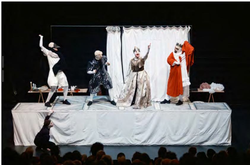
Molière...Tel qu'en lui-même