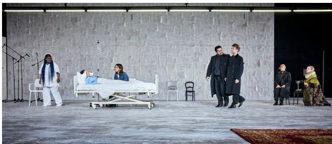
Le livre de K, scène

journaliste, écrivain, conseiller artistique